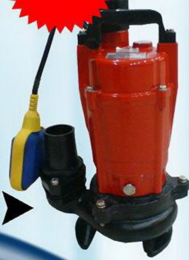
ปั๊msูบน้ำเสีย รุ่น AQ2-22550SA