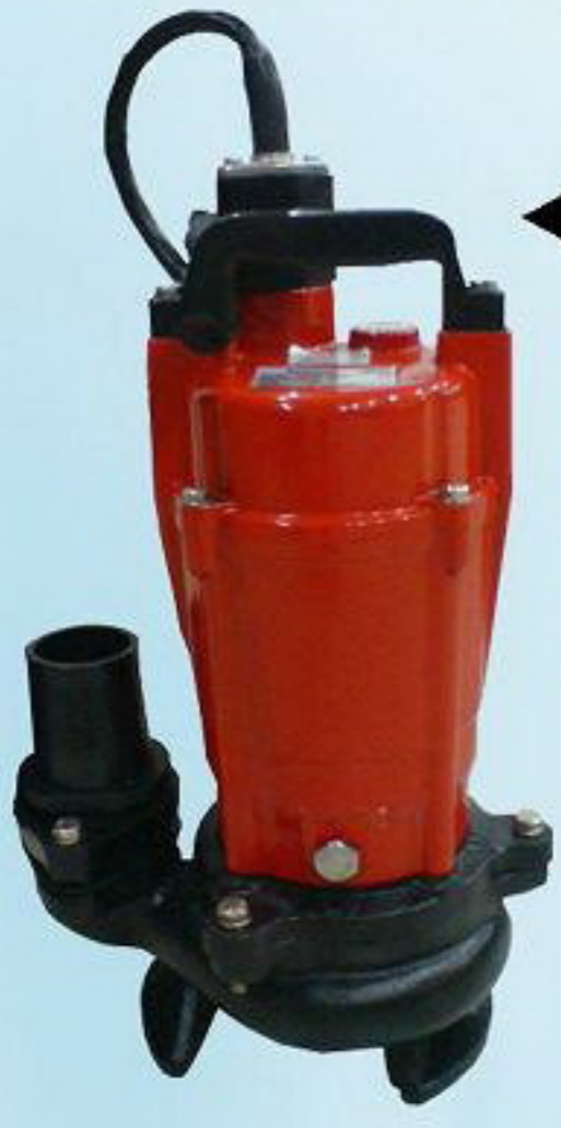
ปั๊msูบน้ำเสีย รุ่น AQS2-22550