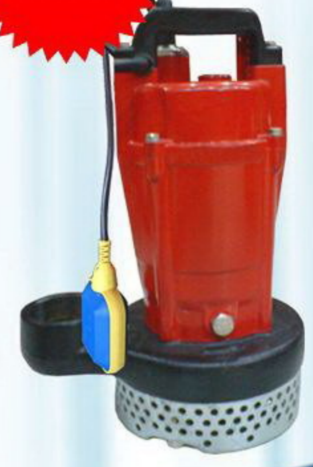
ปั๊msูบน้ำสะอาด รุ่น AQ2-22550A