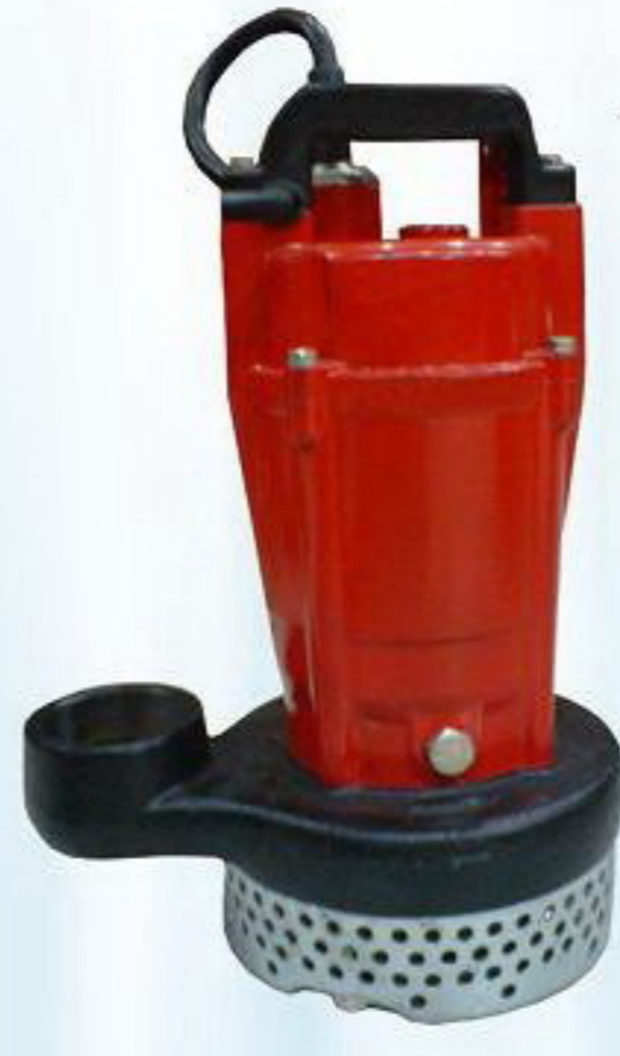
ปั๊msูบน้ำสะอาด รุ่น AQ2-22550